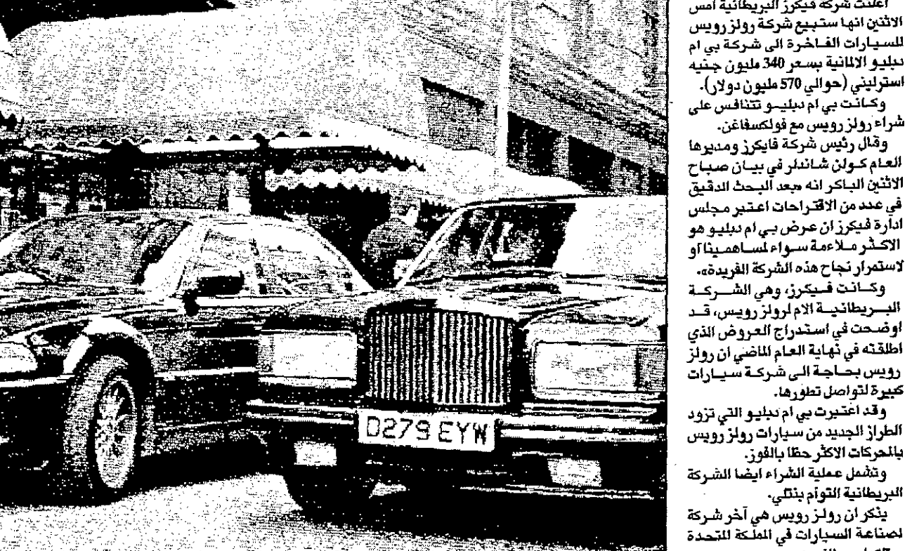
سيارة رولز رويس (يمين) وبي ام دبليو تسيان اسم امجنر هارونز اللدني الشهير